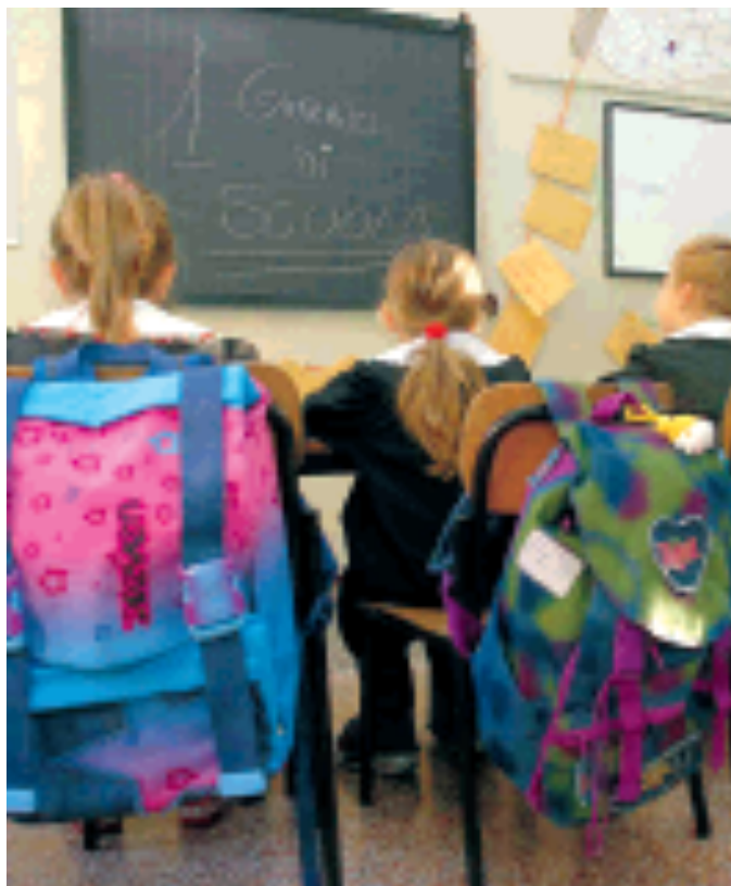
Tre bambine al loro primo giorno di scuola

«Siamo davanti a un disastro, perciò è necessario mettere in campo misure straordinarie e di forte impatto